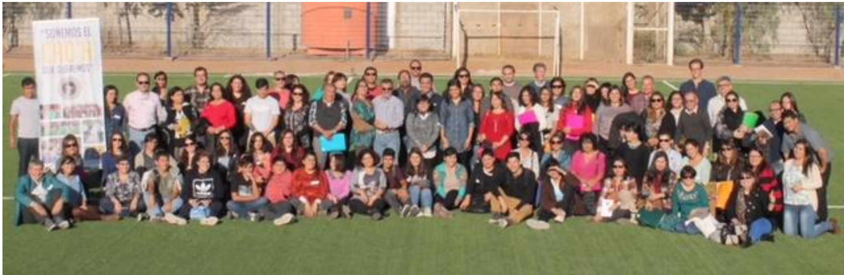
Cumbre "Soñemos el CAO'H que queremos" 2018